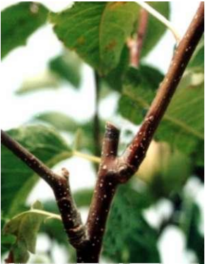
Yanlış Uygulama Tırnak Bırakma

Bu budama yapılırken önce kurumuş kırılmış birbirine girmiş hastalıklı dallar kesilir geri kalan dallarda da kısaltma budamaları yapılarak hatta bazı kalın dallarda kesilerek ağacın taçı küçültülür. Meydana gelen obur dallar, kuvvetli sürgünlerden taç için uygun olanlar bırakılır diğerleri kesilir.